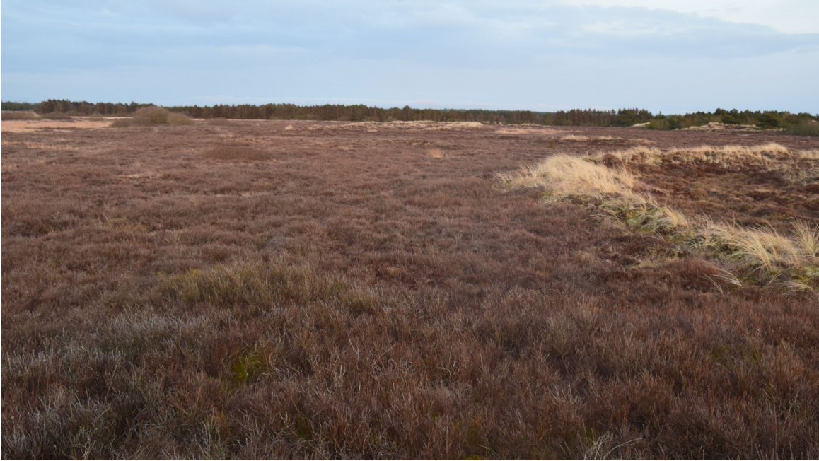
Abbildung 10: Urtümliche Heidelandschaft, Foto

Man kann aber nicht behaupten, daß die Dorfschaft damals in landwirtschaftlicher Beziehung, als die Heideländereien unter den Pflug genommen wurden, sich noch besonderen Aufschwungs erfreuen durften, dann die landesherrlichen Abgaben auf der Geest waren von 1802 her noch immer sehr hoch.