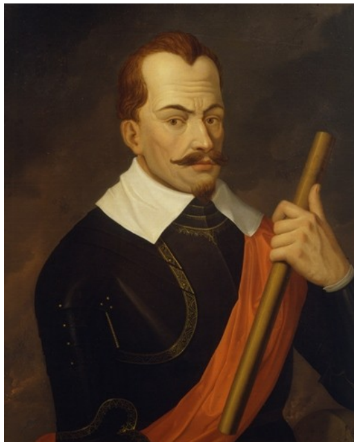
Abbildung 2: Ludwig Ferdinand Schnorr von Carolsfeld (1788-1853), Ölporträt Albrecht Wenzel Eusebius von Wallenstein (1583-1634) im Wiener Heeresgeschichtlichen Museum