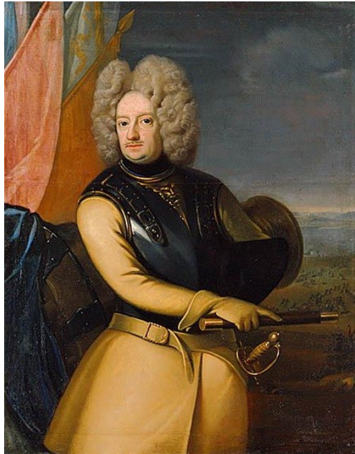
Abbildung 3: Georg Engelhard Schröder (1684–1750), Ölporträt von Magnus Gustafsson Steenbock (1664 - 1717)