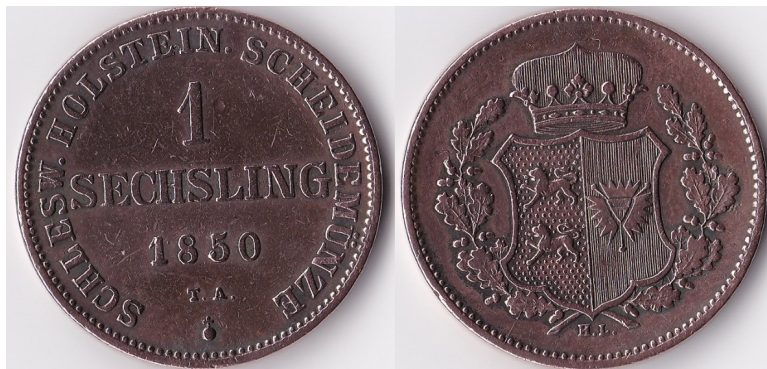
Abbildung 5: Sechsling - Kupfermünze der Statthalterschaft

Durch den am 10. Juli 1849 abgeschlossenen Waffenstillstand Preußens mit Dänemark wurde die politische Lage entschieden ungünstig für Schleswig-Holstein. Die Statthalterschaft und die schleswig-holsteinische Armee wurde auf Holstein eingeschränkt, das Herzogtum Schleswig wurde durch einen dänischen und einen preußischen Kommissar verwaltet; im Norden wurde das Herzogtum durch schwedische und norwegische, im Süden durch preußische Truppen besetzt. Das war allerdings ein schimpflicher Waffenstillstand, herbeigeführt durch die traurigen Zustände Deutschlands.-