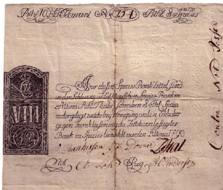
Abbildung 9: Reichsbankzettel der Speciesbank in Altona über den Gegenwert von 8 Talern aus dem Jahr 1790

Die Verwirrung und Zerrüttung, welche durch Herabsetzung des Papiergeldes, sowie durch den gewaltsamen Eingriff in das Privateigentum und in die Rechte der Gläubiger in allen Verhältnissen hervorgerufen wurde, ist nicht zu beschreiben.